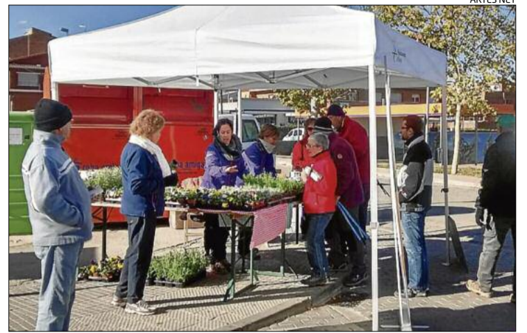
Parada per recollir plantes ubicada al costat de l'escola bressol, ahir

Fins al 2013, les línies d'Artés no distaven gaire de les generals (va