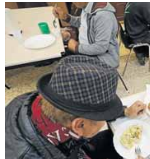
Los beneficiarios de la renta mínima de inserción se han disparado por la crisis. DT

cialmente en una época donde no tenemos garantizadas las pensiones por la futura falta de cotizantes. Hay que cambiar el mensaje que los gobiernos dan a las familias. De hecho nuestro país fue el único de toda Europa que recortó prestaciones a las familias durante la crisis».