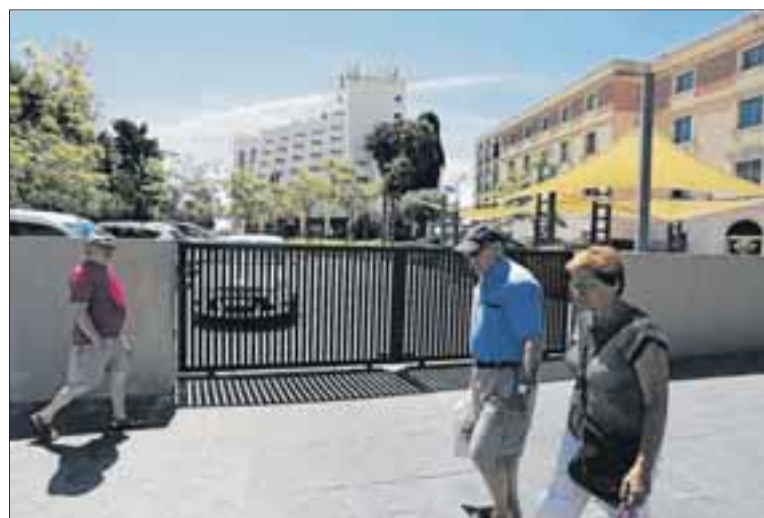
La lista de espera para una residencia de gent gran supera las 2.000 personas en Tarragona. En la foto, la Mare de Déu de la Mercé.

«Fue y sigue siendo una medida muy injusta, en un momento de crisis donde las familias sufrieron devaluaciones de precios de la vivienda, pérdida de puestos de trabajo, pérdida de otras ayudas, pérdida de poder adquisitivo, rebaja de baremos en ayudas como libros y comedor... Era en ese momento cuando las familias necesitaban ayuda de verdad», lamenta Aluja.