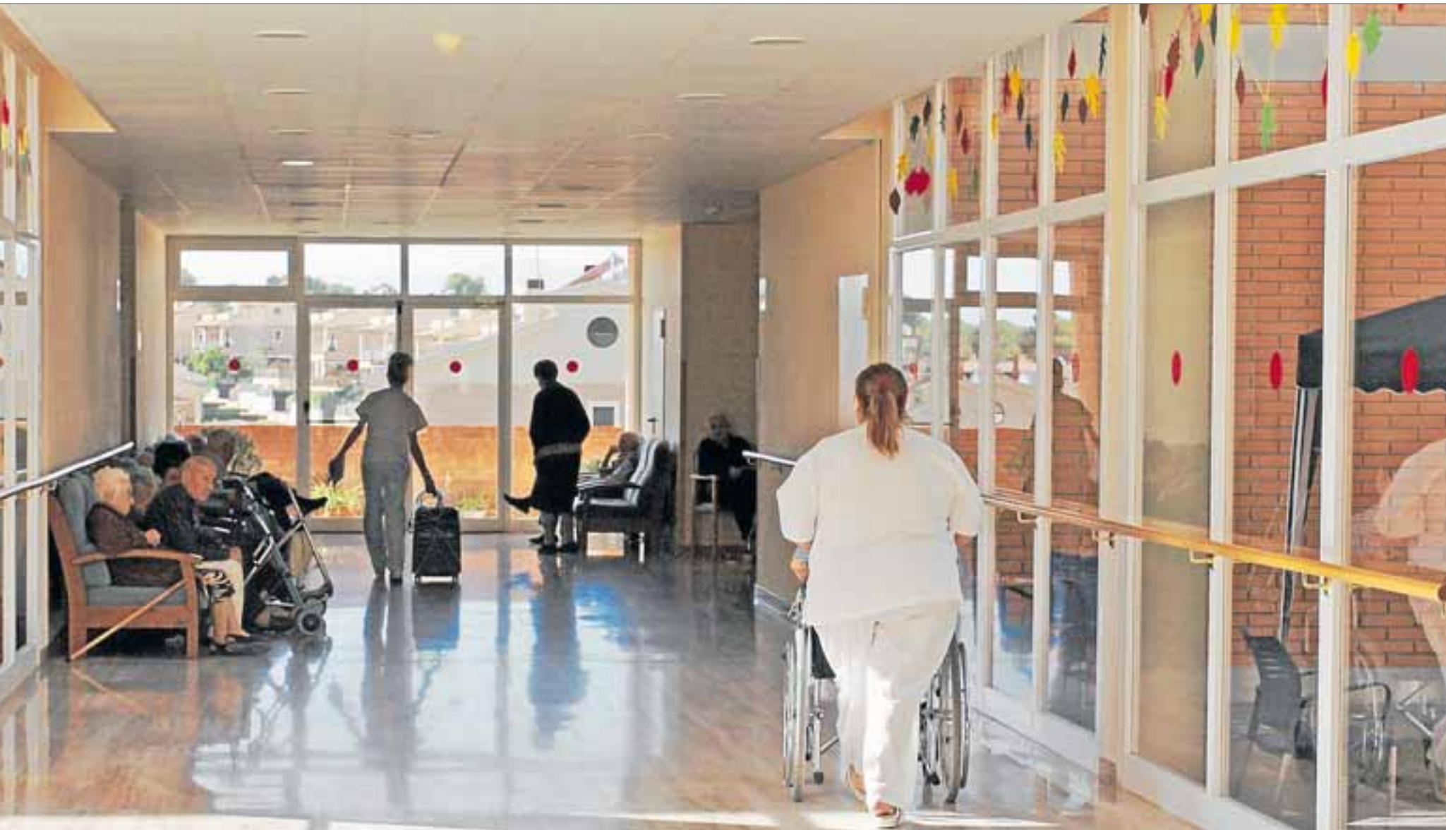
Los requisitos para poder acceder a la ley de dependencia se han endurecido sobremanera. Los beneficiarios han caído en Tarragona mientras suben los solicitantes.