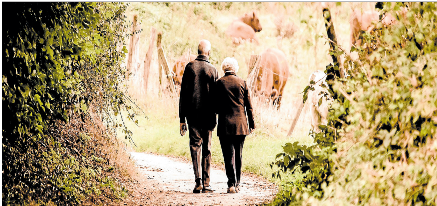
La millora dels hàbits saludables és una de les causes de la disminució del consum de medicaments. DdG