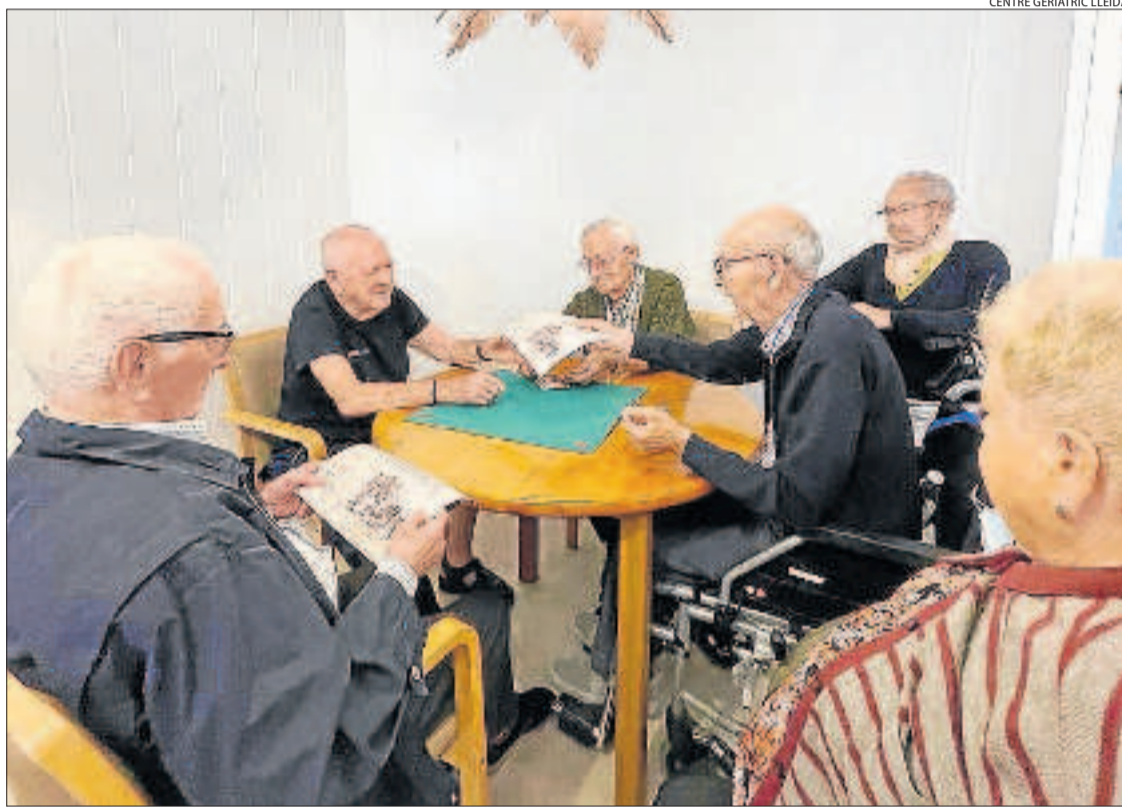
Usuaris del Centre Geriàtric Lleida, que estan dividits en 'mini' residències, jugant a la botifarra.

El 2020 es van infectar de la Covid 2.085 usuaris de Lleida, el 2021 van ser 771 i aquest any, 1.657