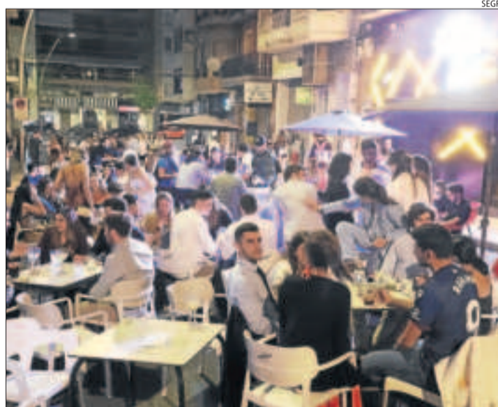
Imatge d'arxiu de terrasses de pubs a Lleida.

BARCELONA | El Govern té fins dimarts per argumentar al Tribunal Superior de Justícia de Catalunya (TSJC) els motius per restringir els horaris de la restauració i tancar l'interior de l'oci nocturn, arran d'un recurs de la patronal Fecasarm contra l'últim decret que ho estipula. El TSJC ha rebutjat forçar una reobertura urgent sense conèixer la versió de l'administració i es pronunciarà una vegada hagi escoltat totes les parts. En una interlocutòria, la sala diu que “encara no compta amb prou elements de coneixement” per decidir i que per això ha d'escoltar el Govern. Poc després de fer-se pública la decisió del TSJC, la