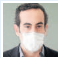
Secretari General de Salut Pública

«Venen dies assistencialment complicats pel degoteig a l'alça d'ingressos a l'UCI»